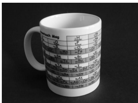
図 3 エレメンタッチの図案を用いたマグ

最近ではエレメンタッチの立体構造をひとつの円筒面上に投影した図案のマグカップ(図 3)も製品化されました 5,6,8) 。従来の周期表を世界地図にたとえ